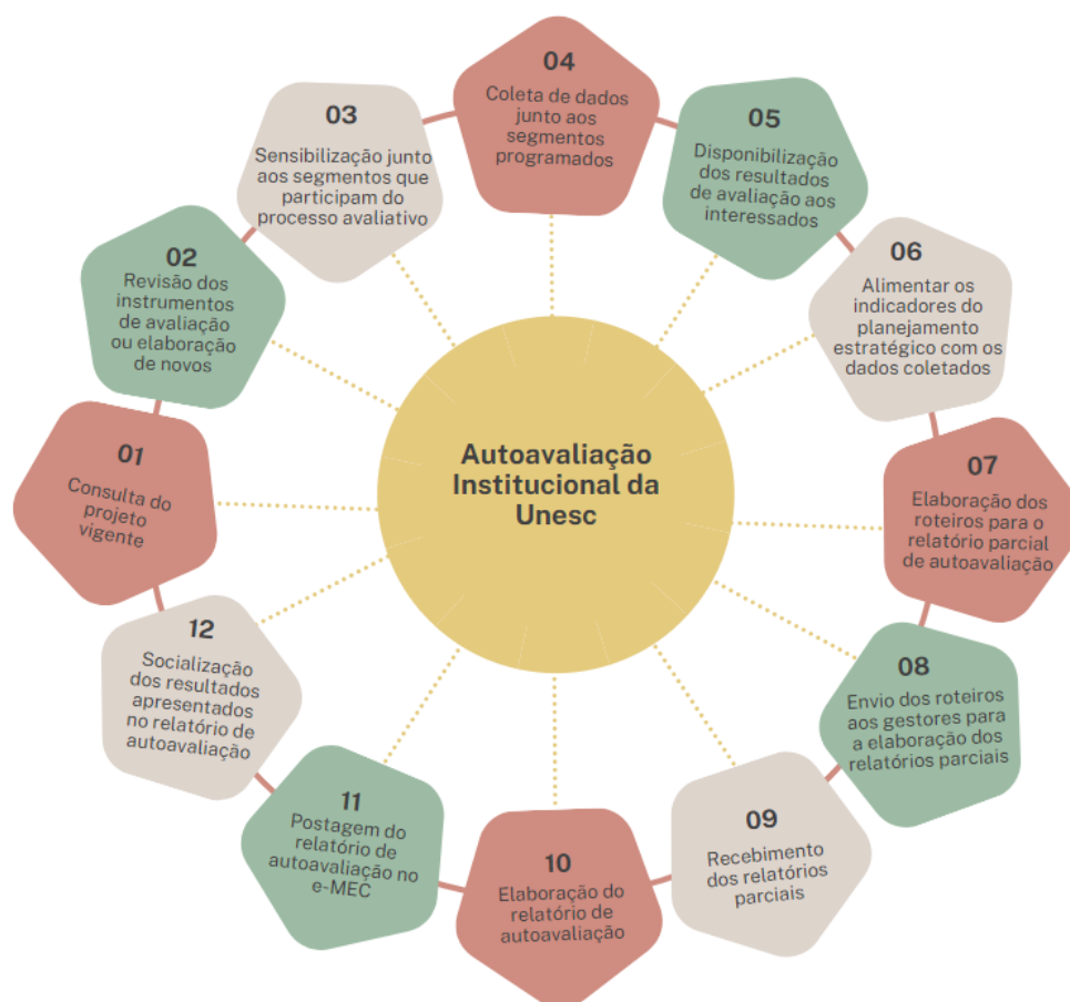
Figura 2 – Fluxograma da Avaliação Institucional da Unesc

A figura 2 demonstra o ciclo observado pelo projeto e suas principais características: