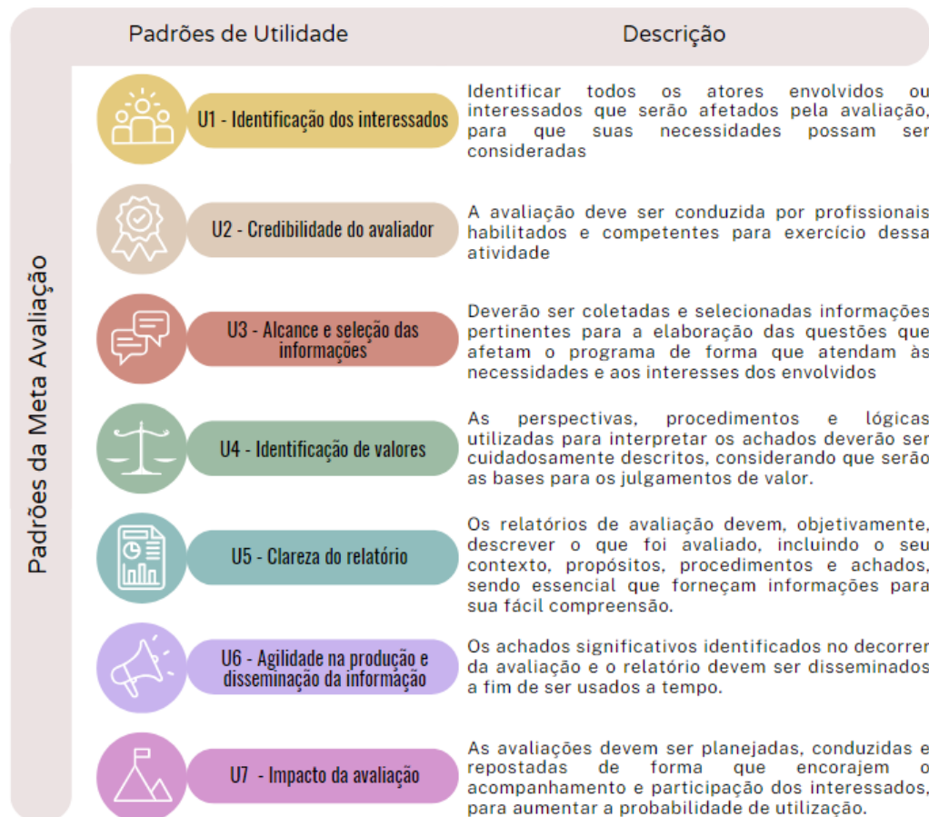
Figura 4 – Padrões da Meta Avaliação Fonte: Adaptado de Worthen, Sanders e Fitzpatrick (2004)

Sob a orientação destes aspectos, na UNESC, a meta avaliação ocorre observando, também, as seguintes diretrizes: